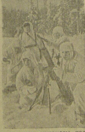
ДЕЙСТВУЮЩАЯ АРМИЯ. На снимках: (слева) отремонтированные трофейные немецкие минометы, подготовленные к отправке в части Красной Армии; (в центре) бойцы Н-ской части отправляются на передовые позиции; (справа) минометчики части майора Константинова на огневой позиции.